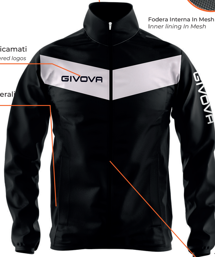
Zip intera Full zip